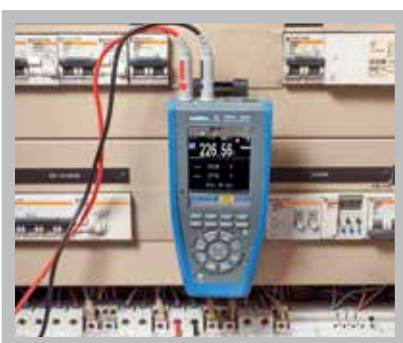
Med Multifix magnet är det enkelt att få händerna fria vid mätning