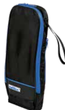
Väska med Multifix magnetsystem