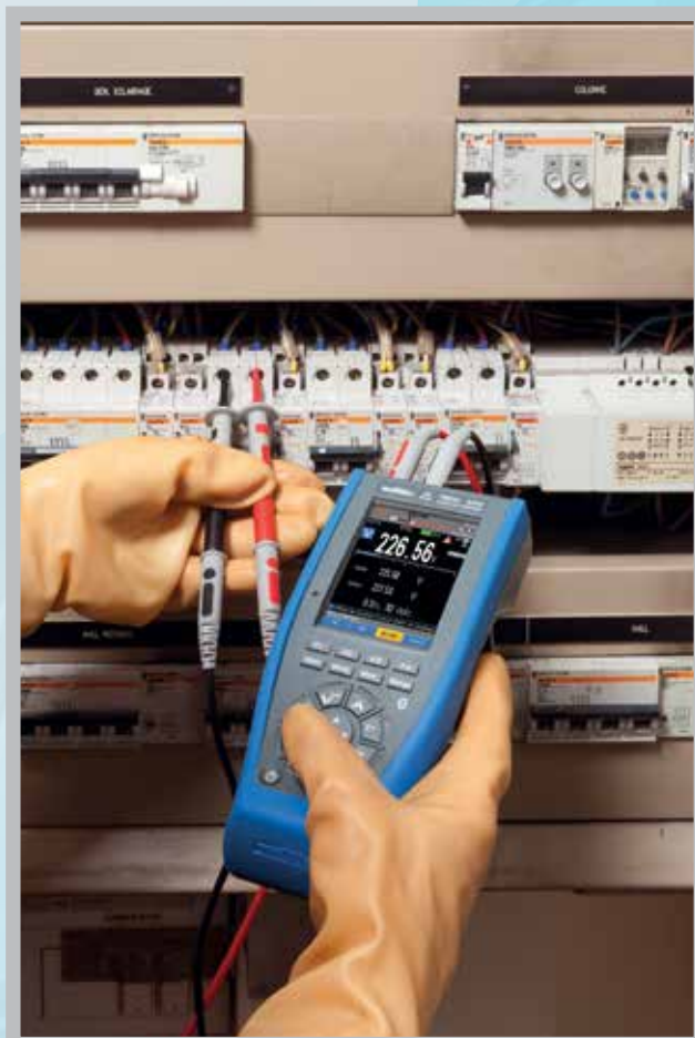
Mätning i ett elskåp