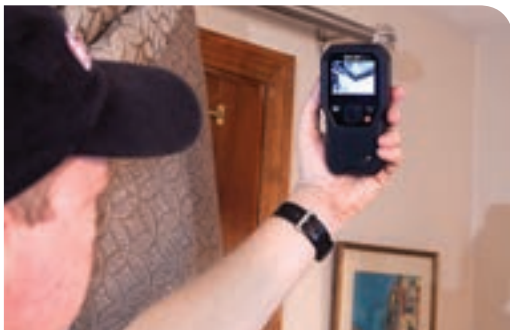
FLIR MR160 scanner loft- og vægfuger for fugtproblemer.