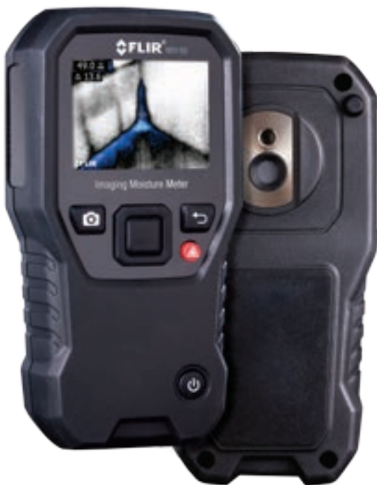
MR160 hygrometer med indbygget termokamera